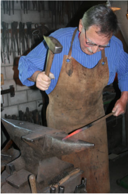
KNOX, am Schmieden

In der Stube erzählt er mir aus seinem vielseitigen Leben. In Buchs SG ist er aufgewachsen, machte bei ELESTA in Bad Ragaz die Lehre zum FEAM (Elektroniker) und wurde dann - berufsbedingt - für die RS zum Funk-Gerätetechnik in der Kaserne Bern aufgebildet. In Buchs SG war ein Technikum geplant aber noch nicht im Bau, also meldete er sich, wie mehrere seiner Zimmerkameraden, für die Aufnahmeprüfung am Technikum Burgdorf. Er hatte Glück und durfte - auch Dank seinem Beitritt zum GVTB - drei intensive aber schöne Jahre in Burgdorf erleben. 1972 wurde er als "Schwachstrom - Inschinör" in die Berufswelt