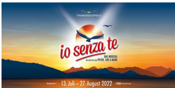
Logo Io senza te

Thunerseespiele – Bekannte Melodien von Peter, Sue und Marc - Do 11. August 2022