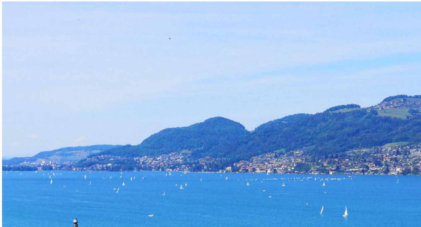
Blick von Spiez über den Thunersee nach Thun