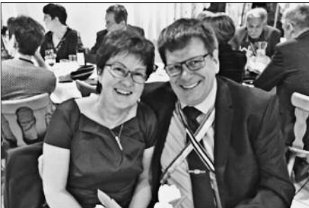
Maya und Phantos