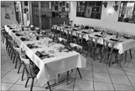
Alles bereit für die Gäste