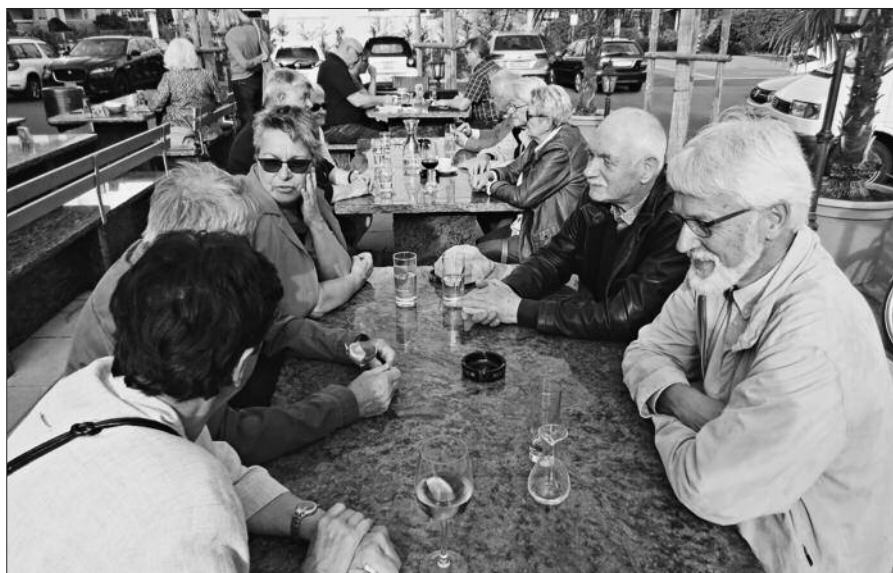
Wir geniessen die Sonne auf der Rössli-Terrasse