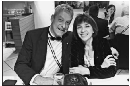
Fränzi und Flup