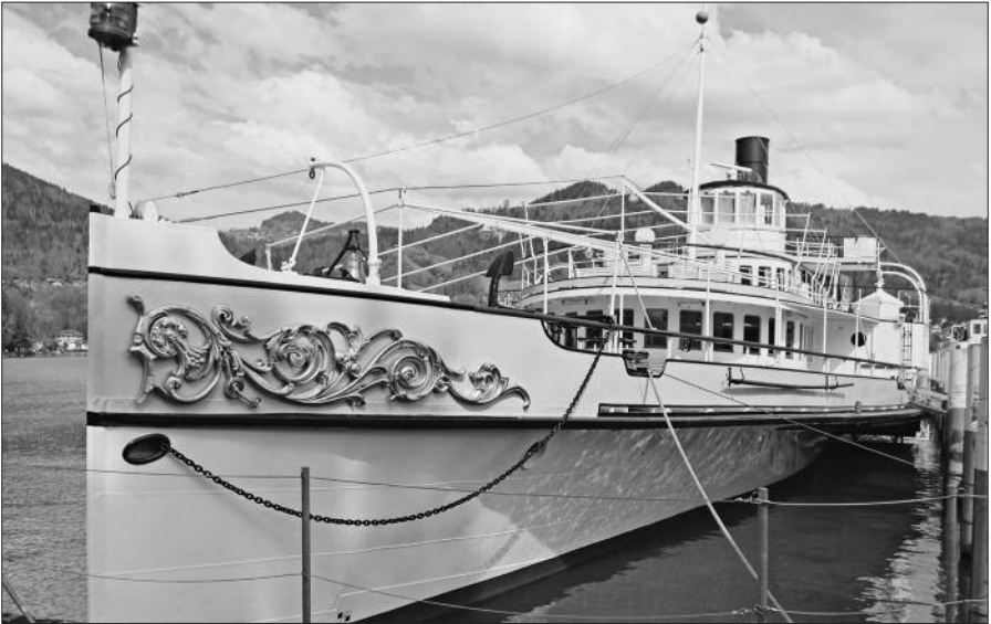
Die stolze Blüemlisalp