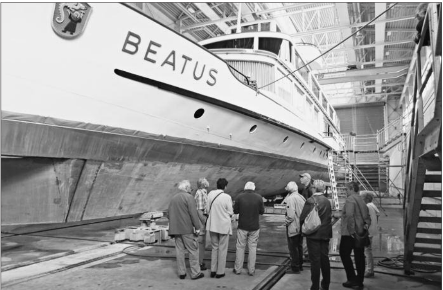
Die Beatus von unten

laden, dem wir natürlich zusprachen. Allerdings war es eher kalt in der Halle und draussen schien die Sonne, weshalb sich der Apéro nicht endlos ausdehnte und wir uns ins Rössli Dürenast (Stammlokal AH-Stamm Thun) verschoben, wo