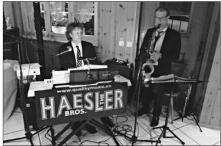
Die Tanzmusik im Einsatz

Am 6. April war es soweit: 26 GVerinnen und GVer in bester Couleurball-Stimmung konnten im Sternen Thörishaus begrüsst werden. Das Duo Häslers Brothers war wieder mit dabei, begleitete uns musikalisch und spielte zum Tanz auf. Nach dem Apéro wurde mit der Bouillon mit hausgemachten Flädli der Start ins Sternenbuffet gemacht.