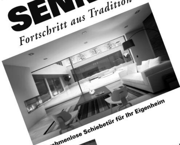
Fast rahmenlose Schiebetür für Ihr Eigenheim